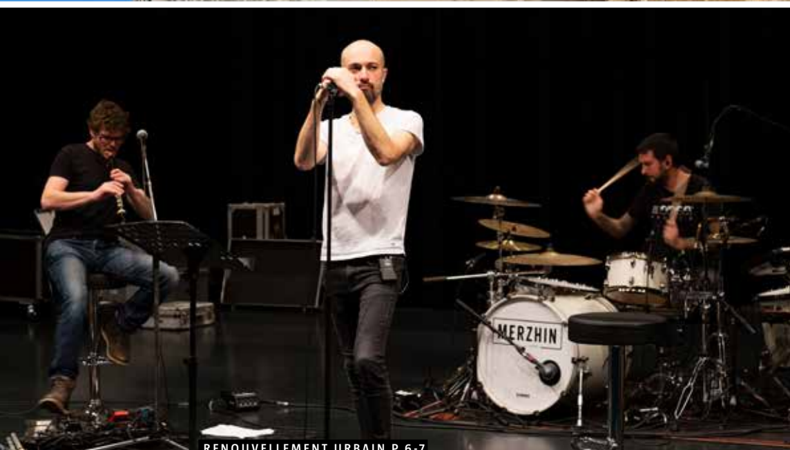
RENOUVELLEMENT URBAIN P.6-7