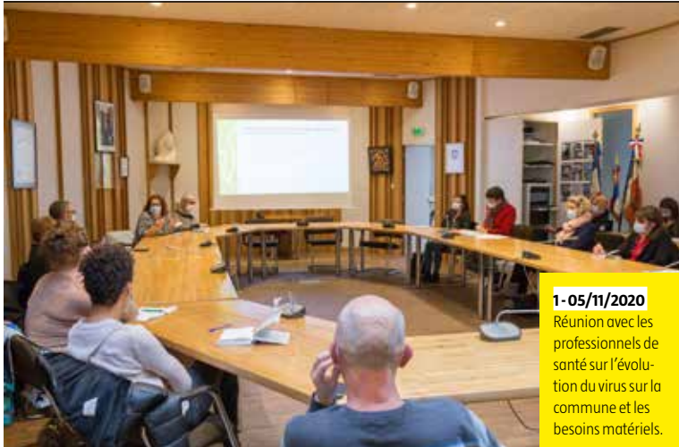
1-05/11/2020 Réunion avec les professionnels de santé sur l'évolution du virus sur la commune et les besoins matériels.