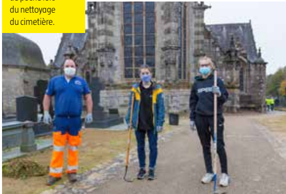
3-22/10/2020 Les bénévoles de Gouesnou Volontariat et les jeunes du dispositif Argent de poche lors du nettoyage du cimetière.