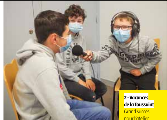
2 - Vacances de la Toussaint Grand succès pour l'atelier radio organisé par le service Jeunesse.